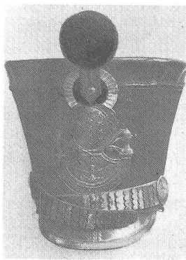
Tschako von Artillerie und Train, 1817—1827. Pompon rot, Kokarde innen rot-weiss. Wappenschild gelb, entspricht dem französischen Vorbild von 1815, mit Bourbonenwappen und Königskrone. Sturmbänder und Schiene gelb. Ehemalige Sammlung H. Pelet.