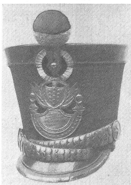
Tschako der Infanterie 1827—1847. Pompon unten weiss, oben rot. Garnituren von weissem Metall. Ehemalige Sammlung H. Pelet.