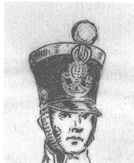
Infanterieoffizier 1817—1827. Pompon weiss. Silberne Borte um Tschakorand. Metallgarnitur versilbert. Zeichnung von L. Rousselot für «Schweizer Uniformen», Tafel 144.