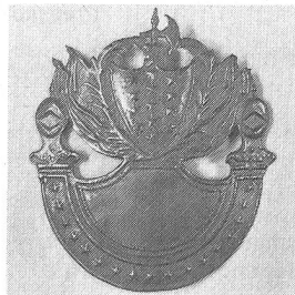
Tschakoschild 1827 für Infanterie von weissem Metall. Die Anordnung entspricht dem französischen Vorbild von 1825. Das Lilienwappen und die Königskrone wurden ersetzt.