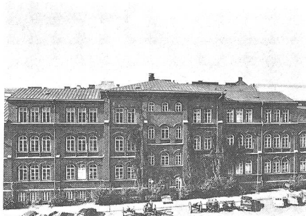
Hier in diesem Gebäude, das 1881 gebaut wurde, befindet sich das finnische Armeemuseum.