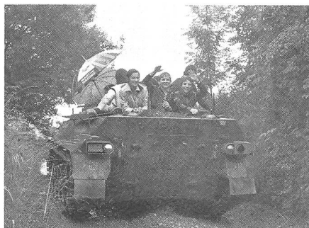
Grosser Spass für junge Leute: eine Fahrt mit dem Schützenpanzer.

Für einen, der nicht «von Dienstes wegen» ständig mit der Materie zu tun hat, war dieses offen und mit Nachdruck bekundete Interesse der Jugend am Bundesheer und an der Landesverteidigung der nachhaltigste Eindruck dieses «Tages der Schule» in der Schwarzenbergkaserne in Salzburg. J-n