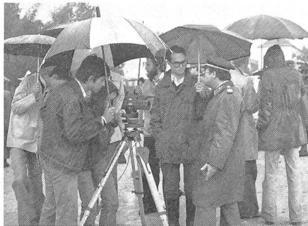
Offiziere, Unteroffiziere und Chargen gaben gerne Auskunft.

Man kann ohne Übertreibung sagen: Dieses «Salzburger Modell» war ein grosser Erfolg und wird wahrscheinlich in den anderen Bundesländern Nachahmung finden. Natürlich gab es kleine Pannen und da und dort Schwierigkeiten, zumal statt der erwarteten 1500 bis 2000 über 6000 Schüler aus dem ganzen Bundesland Salzburg die Kaserne stürmten! Und dazu regnete es zeitweise in Strömen, was aber den 12- bis 18jährigen Burschen und Mädchen nichts ausmachte. Sie zeigten erstaunliches Interesse für Waffen und Ausrüstung, die ihnen von den eingeteilten Soldaten erläutert oder vorgeführt wurden. Besondere Attraktionen waren wie immer das Panzerfahren und die Hubschrauber. Aber auch die Artillerie und die Flab, die Infanterie und die Pioniere, die Fernmelde- und die Flugmeldetruppen und die Versorgungseinheiten hatten nicht über Mangel an «Nachfrage» zu klagen.