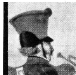
Tschako eines Kavallerietrompeters, 1825. Der Tschako ist ganz rot überzogen. Schwarzer Nakenkirsch. Grünes Pompon. Aus einem kolorierten Stich der «Sulzer'schen Steindruckerei».