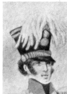
Kommandant der Artillerie, 1825. Vergoldete Metallteile. Weisses Federn. Aus einem kolorierten Stich der «Sulzer'schen Steindruckerei».