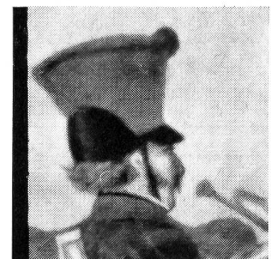
Tschako eines Kavallerietrompeters, 1825. Der Tschako ist ganz rot überzogen. Schwarzer Nackenschirm. Grünes Pompon. Aus einem kolorierten Stich der «Sulser'schen Steindruckerei».