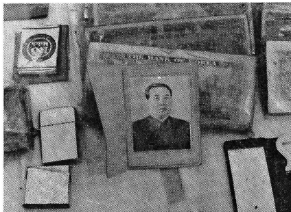
Ausrüstung eines nordkoreanischen Guerilla-Soldaten — alles ist südkoreanisch getarnt, nur das Bild von Kim Il-sung (Mitte) ist verräterisch.

Marinestreitkräfte erneut ein nordkoreanisches Guerilla-Schiff. Anfang Mai gelang es der Polizei, in der Nähe Pusans zwei Guerillas zu überwältigen. Allein im letzten Juni scheinen drei Kommandos in Südkorea gelandet zu sein; teilweise flüchteten die Guerillas nach einem Feuergefecht — von den anderen hingegen hörte man nie wieder etwas. Ende desselben Monats kam es bei der Provinzhauptstadt Kwangju zu einer verbissenen Schiesserei, als sich zwei Guerillas entdeckt sahen. Anfang August wurde in den Bergen ein weiterer Guerilla erschossen. Mitte September konnte im Schutz der Dunkelheit bei einem einsamen Küstenstreifen ein nordkoreanisches Kommando an Land gehen, dessen Ziel augenscheinlich Sabotage an militärischen Einrichtungen war. Anfang Oktober vergangenen Jahres versenkten Marine und Luftwaffe Seouls im Gelben Meer erneut ein nordkoreanisches Guerilla-Schnellboot.