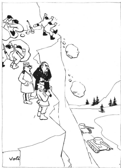
«Etwas im argen liegt sie schon, unsere Panzerabwehr für mittlere Reichweiten!»

Doch niemand, wirklich niemand hat so rechte Lust, damit sich noch auseinanderzusetzen. Als erstes gilt es nun, Distanz zu gewinnen. Dann wird man einiges anders beurteilen. Was auf keinen Fall heissen soll, dass das zu Krisisierende, zu Verbessern vergessen werden soll. An der Institution Armee wird es immer etwas zu verbessern geben. Und zwei Punkte müssen dabei stets oberstes Primat bleiben: das Gebot der Kriegstauglichkeit, aber auch die Würde und Persönlichkeit des Menschen, des Schweizer Bürgers.