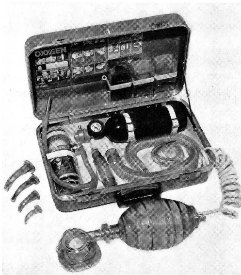
Erste-Hilfe-Koffer, Modell Modulaide Oxygen Jet