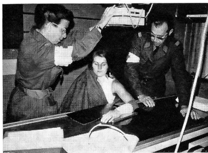
Blick in das Röntgenzimmer eines Territorial-Rotkreuz-Detachementes.

Jedermann findet sich an seinem, am Vorabend zugeteilten Einsatzort ein. Einrichten der einzelnen Arbeitsplätze, was uns bis Mittag in Anspruch nimmt. Nach dem Essen werden wir überraschend orientiert, dass nach der Übungsanlage der Feind die Schweiz betreten habe. Sofort wird der turnusgemässe 24-Stunden-Betrieb aufgenommen. — Überraschung Nummer zwei: Übungsunterbruch um 18 Uhr.