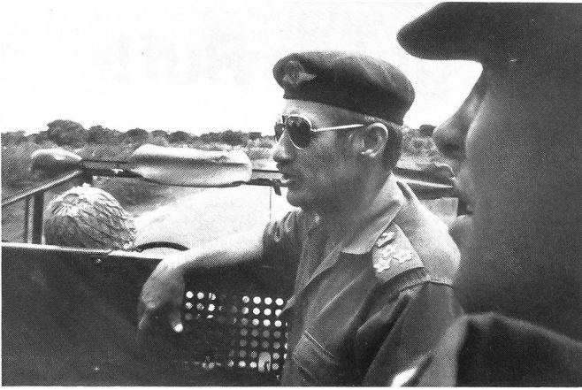
Brigadegeneral du Plessis, Kommandant eines Grenzabschnitts.