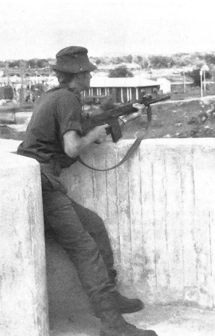
Behelfsmässig betonierter Beobachtungsposten.