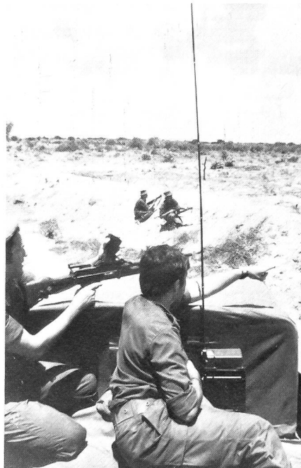
Aufklärungspatrouille im Grenzgebiet.