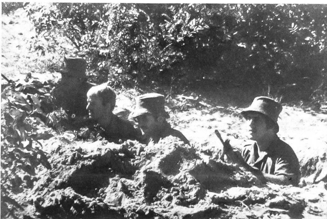
Südafrikanische Infanteristen in einer Hinterhaltstellung.