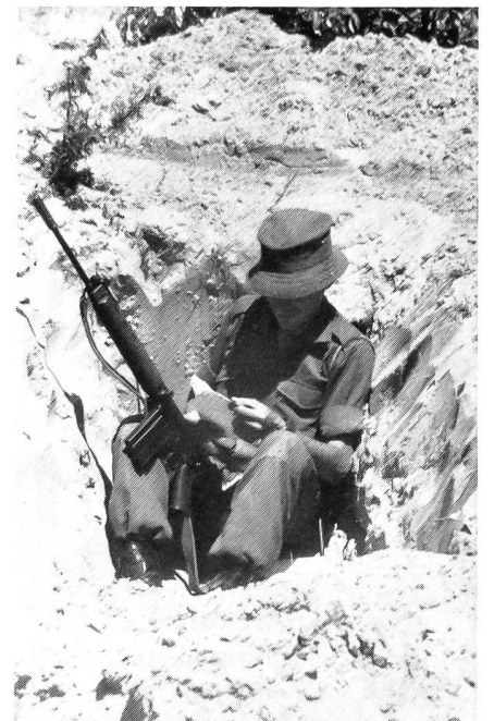
Infanterist in einem Schützenloch.