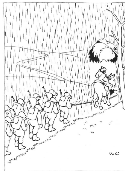
«Marschhalt — 15 Minuten Pause!»

«Eine direkte Bedrohung der Schweiz ist nur vorstellbar in einem europäischen Konflikt, wenn die heutigen Fronten ins Wanken geraten sind und die militärpolitische Lage sich wesentlich verändert hat. Das ist nach Ausbruch von Feindseligkeiten allerdings innert kurzer Frist möglich. Dass unser Territorium als möglicher Operationsraum betrachtet wird, lässt sich auf einfache Weise an der beträchtlichen Spionagetätigkeit gegen unser Land erkennen. In den letzten zehn Jahren wurden 41 Fälle von Spionage gegen die Schweiz aufgedeckt. 71 Personen, wovon 23 ausländische Diplomaten, waren darin verwickelt. Dass nun auch noch ein pensionierter Brigadier dazu kam, ist blamabel und erschütternd zugleich. Wir haben allen Grund, diese aggressive Nachrichtentätigkeit ernst zu nehmen, denn es ist wohl kaum anzunehmen, dass das von Agenten gesammelte Material nur zur Anfertigung militärischer Bilderbücher benötigt wird.» P. J.