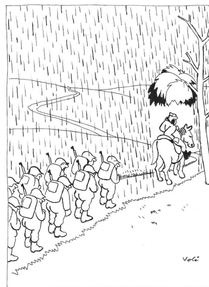
«Marschhalt — 15 Minuten Pause!»