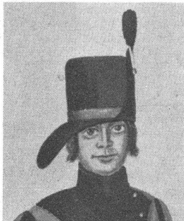
Zeittafelhut eines Tambours, 1809. Weisse Gänse. Gelbes Kopfband. Rotes Pompon. Gleiche Herkunft wie oben.