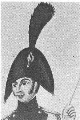
Zweispitz eines Offiziers der Linieninfanterie, 1809. Kokarde: innen hellbau, aussen rot. Weisse Gänse. Aquarell im Museo Civico, Lugano.