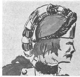
Mütze eines Jägeroffiziers der leichten Infanterie im Freiwilligenkorps der Bürgerschaft der Stadt Lugano, die «Weissen», 1797—1802. Weissmetallenes Stirnschild, pelzgefüttert. Roter Gupf. Darüber eine Raupe wie ein Waschbärenschwanz (vgl. «David Crocket»). Nach einem kolorierten Stich von Toricelli. Museo Civico, Lugano.