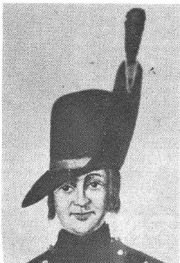
Zeittafelhut der leichten Infanterie, 1809. Weisse Gänse. Grünes Kopfband. Kokarde: innen hellblau, aussen rot. Grünes Pompon. Herkunft wie oben.