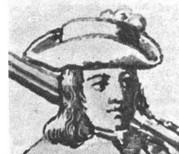
Aufgeschlagener Filzhut für einen Soldaten, um 1728. Aus einem, von Johannes Greuter zu Roggwil gestifteten Glasfenster. Histor. Museum Bern.