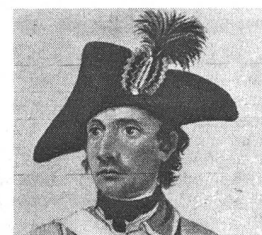
«Christian Reichenbach, Wachtmeister der Berner Zuzüger» an der Grenze, 1792. Aus einer aquarellierten Zeichnung von Franz Niklaus König. Kunstmuseum Bern.