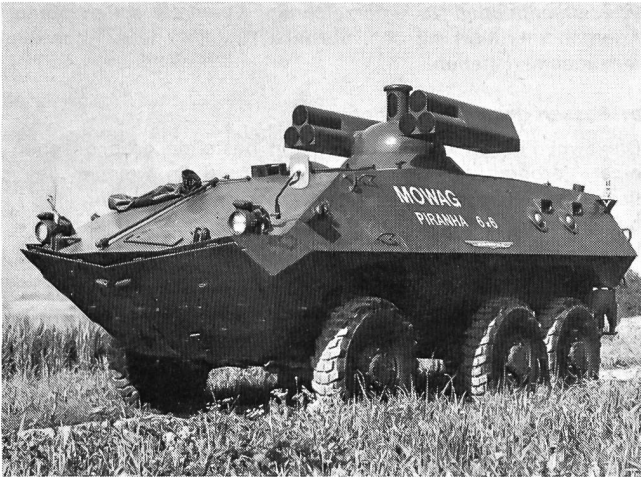
PIRANHA 6x6 als Raketenträger

die gepanzerte amphibische Radpanzerfamilie modernster Konzeption