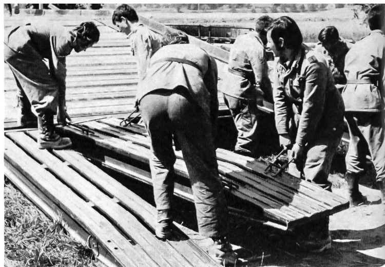
Die Rampenplatten werden eingebaut.