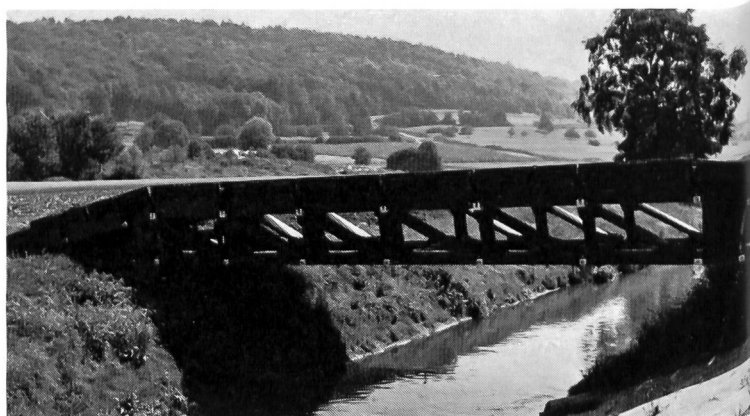
Feste Brücke 69