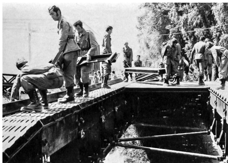
Einbau der Fahrbahnplatten und Randbleche