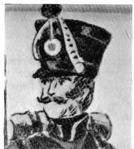
Tschako eines Scharfschützen, zwischen 1845 und 1848. Gelbe Sturmbänder. Kokarde: innen rot, ausser weiss. Pompon grün. Gleiche Quelle wie oben.