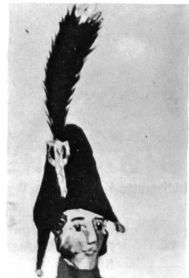
Zweispitz eines Offiziers, 1813. Aus einem Miniatu- raquarell in der Berner Uniformenhandschrift 1813, Blatt 53. Hier nach einer Kopie von A. Pochon. Schweizerische Landesbibliothek.