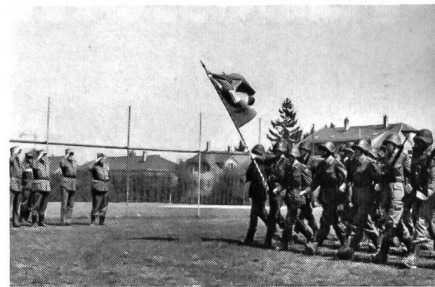
Fahnenübergabe vor dem WK