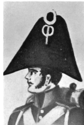
Zweispietz, 1813. Ausschnitt aus einem Miniaturaquarell in der Berner Uniformenhandschrift 1813, Blatt 86. Hier nach einer Kopie von A. Pochon. Schweizer Landesbibliothek Bern.