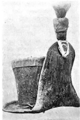
Zeittafelhut, offiziell «runder Hut» genannt, um 1815. Ehemalige Sammlung Henri Pelet. Kokarde: schwarz-weiss-schwarz-weiss. Gelbe Gänse. Pompon: unten rot, oben hellblau. Rote Wollfransen.