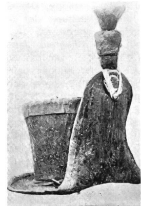
Zeittafelhut, offiziell «runder Hut» genannt, um 1815. Ehemalige Sammlung Henri Pelet. Kokarde: schwarz-weiss-schwarz-weiss. Gelbe Gänse. Pompon: unten rot, oben hellblau. Rote Wollfransen.