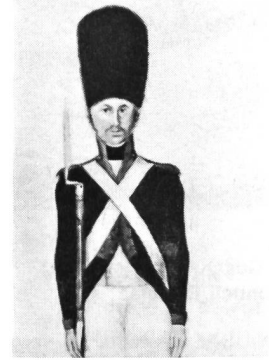
Grenadier der Kompanie Wetter von Herisau, vor 1815. Aus einem Aquarell in Fisch-Chronik, Band 7, Seite 42. (Vgl. dazu den Liquidationskatalog der Sammlung Ernest Ponti, Nr. 560: Al. Tobler, auf dem Brühl, Grenadier von Herisau, Aquarell abgebildet auf der Tafel XXXI.)