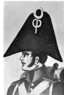
Zweispitz, 1813. Ausschnitt aus einem Miniatur-aquarell in der Berner Uniformenhandschrift 1813, Blatt 86. Hier nach einer Kopie von A. Pochon. Schweizer Landesbibliothek Bern.