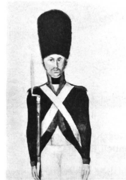
Grenadier der Kompanie Wetter von Herisau, vor 1815. Aus einem Aquarell in Fisch-Chronik, Band 7, Seite 42. (Vgl. dazu den Liquidationskatalog der Sammlung Ernest Ponti, Nr. 560: Al. Tobler, auf dem Brühl, Grenadier von Herisau, Aquarell abgebildet auf der Tafel XXXI.)