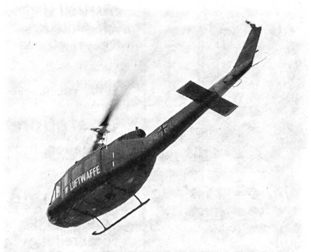
Hubschrauber UH-1 D Iroquis. Jeder 50. Besucher der Ausstellung durfte einen halbstündigen Helikopterflug geniessen.

20 Thurgauer Unteroffiziere haben auf Einladung im benachbarten Deutschland die Wanderausstellung «Unsere Luftwaffe» besucht.