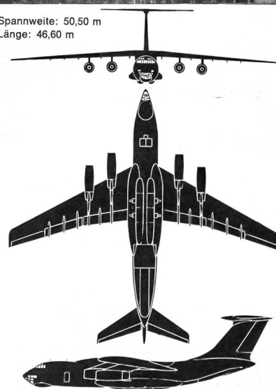
Transportflugzeug J-176 (NATO-Code: Candid)

4 Düsentriebwerke von je 12 000 kp Zuladung: etwa 40 t