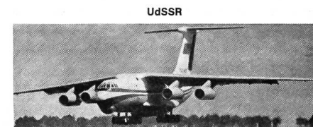
UdSSR Spannweite: 50,50 m Länge: 46,60 m