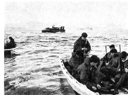
Englische Marinefüsilieri der 3. Kommando-Brigade werden mit leichten Sturmbooten in einem norwegischen Fjord an Land gesetzt. Im Hintergrund erkennt man die militärische Version eines Luftkissenbootes (Hovercraft).

Im September 1972 fanden im Raum Nordatlantik die grössten Land-, See- und Luftmanöver der NATO seit den Silver-Tower-Übungen von 1968 statt. Nicht weniger als elf NATO-Staaten, die zusammen 64 000 Mann, 300 Schiffe und 700 Flugzeuge stellten, nahmen daran teil.