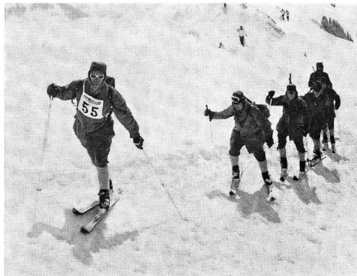
Patrouille des Wiener Jägerbataillons Nr. 4.