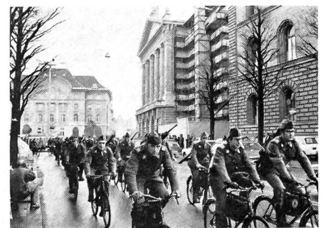
Angehörige der Rdf-Truppe, die am 25. November 1972 in Bern mit Erfolg gegen die drohende Auflösung ihrer Einheiten demonstrierten.

Bekanntlich nimmt der Anteil der Militärausgaben am Bundeshaushalt eher ab als zu; die finanziellen Mittel sind knapp, allenthalben müssen Abstriche in Kauf genommen werden, auf 60 neue Flugzeuge wird verzichtet, für eine Neueinkleidung aber sind die Millionen vorhanden! Eine neue Uniform übrigens, die genau wie die jetzige nur im Ausgang getragen wird.