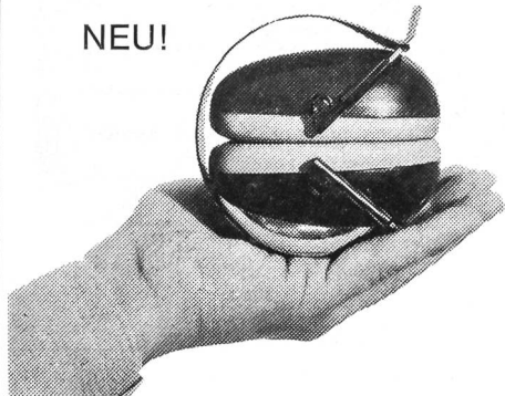
Modell H-4F, zusammenlegbar Patent angemeldet