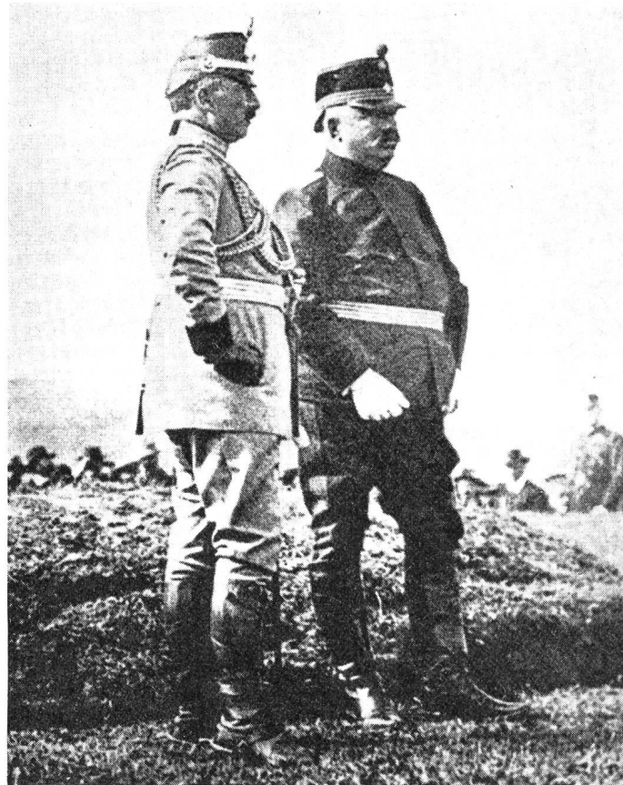
Kaiser Wilhelm II. und Oberstkorpskommandant (später General) Ulrich Wille auf dem Manöverfeld.

Nicht nur auf dem «Feldherrenhügel» (später von den Anwohnern noch lange «Kaiserhügel» genannt) drängten sich «riesige Menschenmengen» — auch übers ganze Manövergelände zerstreut wogten die Zuschauer hin und her. Sobald sich der Herrscher