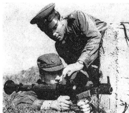
Ungarische Soldaten werden am Rak-Rohr ausgebildet

In zahlreichen Kasernen der ungarischen Volksarmee wurden neue, modern ausgestattete Lehrsäle, Fachklassen und Kabinette geschaffen, die eine bessere Ausbildung ermöglichen. Die meisten Ausbildungsstätten arbeiten jetzt mit elektronisch und automatisch oder zumindest halbautomatisch gesteuerten Einrichtungen und Anlagen. Bei der Ausbildung spielen Funk, Fernsehen und Film eine immer grössere Rolle. In mehreren Kasernen wurde auf Initiative der Volksarmisten und mit eigenen Mitteln ein objekteigenes Fernsehnetz für Unterricht und Ausbildung aufgebaut, das ein eigenes Programm sendet.