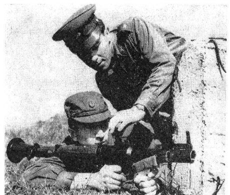
Ungarische Soldaten werden am Rak-Rohr ausgebildet

In zahlreichen Kasernen der ungarischen Volksarmee wurden neue, modern ausgestattete Lehrsäle, Fachklassen und Kabinette geschaffen, die eine bessere Ausbildung ermöglichen. Die meisten Ausbildungsstätten arbeiten jetzt mit elektronisch und automatisch oder zumindest halbautomatisch gesteuerten Einrichtungen und Anlagen. Bei der Ausbildung spielen Funk, Fernsehen und Film eine immer grössere Rolle. In mehreren Kasernen wurde auf Initiative der Volksarmisten und mit eigenen Mitteln ein objektweises Fernsehnetz für Unterricht und Ausbildung aufgebaut, das ein eigenes Programm sendet.