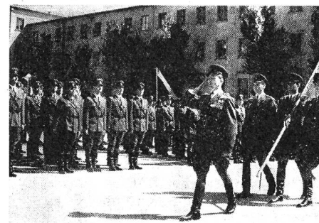
Offiziere der ungarischen Volksarmee