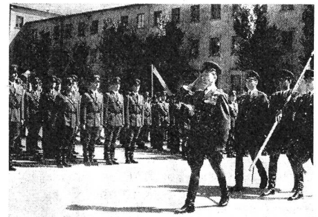
Offiziere der ungarischen Volksarmee