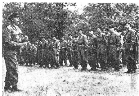
Arbeitermiliz erhält Kampfauftrag während einer Übung.

Sold wird nicht ausgerichtet. Kleinere Vergütungen (z. B. Fahrgeld) werden in der Regel für Gemeinschaftszwecke (Ausflug, Familienabend) verwendet. Man legt Wert darauf, dass die Milizionäre auch im Privatleben zusammenkommen und kameradschaftliche Beziehungen pflegen. Mit der paramilitärischen Arbeitermiliz verfügt die ungarische Regierung über eine Truppe, die sowohl für den Ordnungsdienst im Innern als auch für die Verteidigung der Volksrepublik eingesetzt werden kann. P. G.