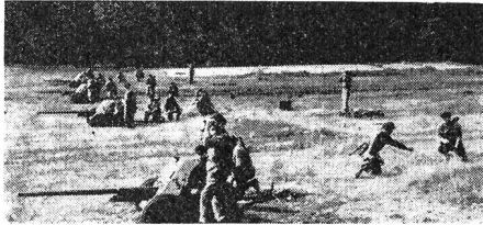
Schiessübung mit 40-mm-Pak.

Die Arbeitermiliz ist in Züge, Kompanien und Bataillone gegliedert. Zurzeit verfügt sie über etwa 70 Bataillone; 60 davon sind im Land verteilt und 10 bilden die Budapest-er Arbeitermiliz, wobei die Industriequartiere der Hauptstadt über je ein Bataillon verfügen. Die Gesamtstärke der Arbeitermiliz wird mit etwa 35 000 Mann beziffert.