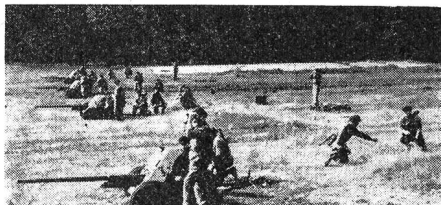
Schiessübung mit 40-mm-Pak.

Die Arbeitermiliz ist in Züge, Kompanien und Bataillone gegliedert. Zurzeit verfügt sie über etwa 70 Bataillone; 60 davon sind im Land verteilt und 10 bilden die Budapest-er Arbeitermiliz, wobei die Industriequartiere der Hauptstadt über je ein Bataillon verfügen. Die Gesamtstärke der Arbeitermiliz wird mit etwa 35 000 Mann beziffert.