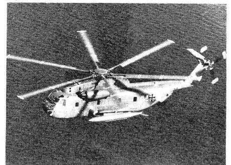
Sikorsky CH-53 D

Mit der Einführung der Sikorsky-CH-53 G-Helikopter in der Bundeswehr findet eine weitere Reorganisation der deutschen Heeresfliegerverbände statt. Nach dieser Umstrukturierung werden die Heeresflieger wie folgt aufgeteilt sein: