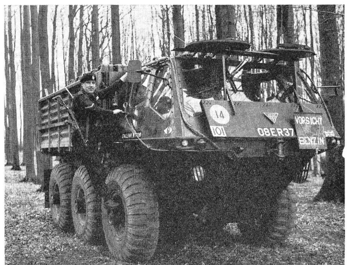
Das hochmobile, voll schwimmfähige Stalwart-Nachschubfahrzeug während einer Gefechtspause.