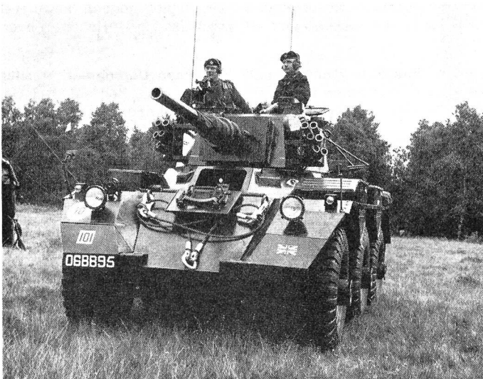
Der weltweit im Einsatz stehende, erfolgreiche Saladin-Panzerspähwagen.

Die gepanzerten Aufkl Rgt sind die wahren Nachfolger der traditionsreichen leichten Kavallerie der vergangenen Tage. Sie sind die Augen und die Ohren der Kommandanten am Boden. Unterstützt von Helikoptern und Jabo-Luftaufklärung, sind sie in der Lage, eine weite Front schnell und ohne grossen Lärm aufzuklären und wenn nötig für ihre Information zu kämpfen. Sie sind ein taugliches Mittel bei einem Rückzugsgefecht und eine unschätzbare Hilfe bei einem Vormarsch. Ihr ausgesprochener Waffenstolz und ihre ausgezeichnete moralische Verfassung, die sich auf ein gutes Training stützen, haben sich sowohl in zwei Weltkriegen als auch auf den Kriegsschauplätzen der Nachkriegszeit bewährt.