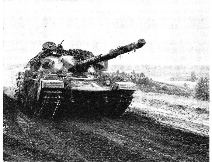
Der Chieftain-Kampfpanzer, der Stolz der britischen Armee.

Und wie verhält es sich nun mit dem Chieftain-Kampfpanzer, dem Stolz der britischen Armee? Als Nachfolger des erfolgreichen Centurions wurde in jahrelanger Forschungs- und Entwicklungsarbeit ein Panzer geschaffen, der die Bedürfnisse nach wirkungsvollerer Feuerkraft, besserem Panzerschutz, grösserem Aktionsradius und höherer Mobilität voll erfüllt. Dazu kommt noch die Verwirklichung weiterer Forderungen, die auf Grund von Erfahrungen aus den letzten Kriegen stammen und die leistungsfähigere Feuerleitsysteme, bessere Munition und höhere Feuereschwindigkeit verlangen. All das führte zur Produktion eines Panzers, der allen zurzeit im Einsatz stehenden oder während der nächsten zwei Jahrzehnte in den Dienst gelangenden Kampfpanzern überlegen sein soll.