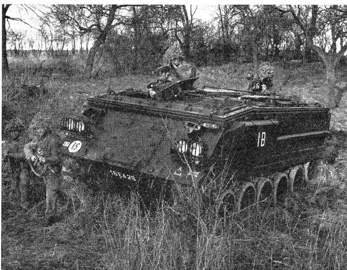
Der Schützenpanzer FV.432 während einer Gefechtsübung.

Angetrieben von einem Rolls-Royce-Motor B 81 mit 220 BHP, besitzt der FV.622 auf der Strasse einen Aktionsradius von 400 Meilen. Um das Be- und Entladen zu vereinfachen, kann man die Brückenwände herunterlassen. Die Ladebrücke hat im übrigen die gleiche Höhe wie der hintere Teil des Chieftain. Der Stalwart kann sämtliche NATO-Standardgebäude aufnehmen und ist mit