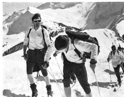
Flott hielten sich die beiden Patrouillen der Engländer, die sich den für sie ungewohnten Strapazen erfolgreich unterzogen.