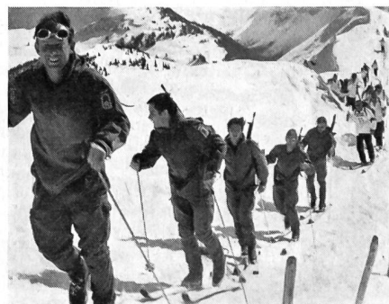
Eine der beiden Mannschaften der deutschen Bundeswehr.