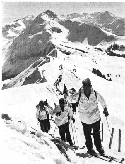
Der erste Marschtag, ein prachtvoller Vorfrühlingstag mit einer vom wolkenlosen blauen Himmel brennenden Sonne, führte von St. Stephan auf die Höhe des Gandlauenengrates (2078 m), hinüber zum Rinderberg, wo dann die rassige Abfahrt nach Zweisimmen folgte.

Unser Bildbericht will den Lesern einen Einblick in diese harte, aber durch das Erlebnis der winterlichen Bergwelt des Vorfrühlings im Obersimmental tausend-fach belohnte Leistungsprüfung geben, die