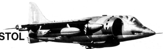
HS Harrier V/STOL