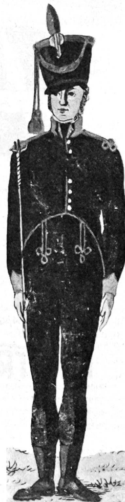
Alte Schweizer Uniformen 27