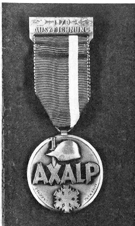
5. Militär-Skitage Axalp 23. und 24. Januar 1971

Kameraden, reserviert euch dieses Datum zum Besuche dieser gelungenen Veranstaltung.