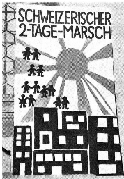
Eine der preisgekrönten originellen Zeichnungen des Zeichnungswettbewerbs der Schweizer Schulen. Über dem Grau der Städte geht die Sonne auf und begleitet die Wanderer durch das weite Bernbiet.

Mit dem offiziellen Schlussakt des 11. Schweizerischen Zwei-Tage-Marsches, der Anfang November im Rathaus zu Bern stattfand, wurde auch der Startschuss zum 12. Marsch gegeben, der am 15./16. Mai 1971 durchgeführt wird. Es handelte sich in Bern um die Abgabe der Wanderstandarten an die Gruppen verschiedener Kategorien, die am meisten Teilnehmer an den Marsch brachten. Das sind keine Preise oder Siegerehrungen, sondern Zeichen der Anerkennung, die weitere Kreise ziehen sollen, um immer mehr Gruppen an diese originelle Leistungsprüfung ohne Ränge, Bestzeiten und Preise zu bringen.