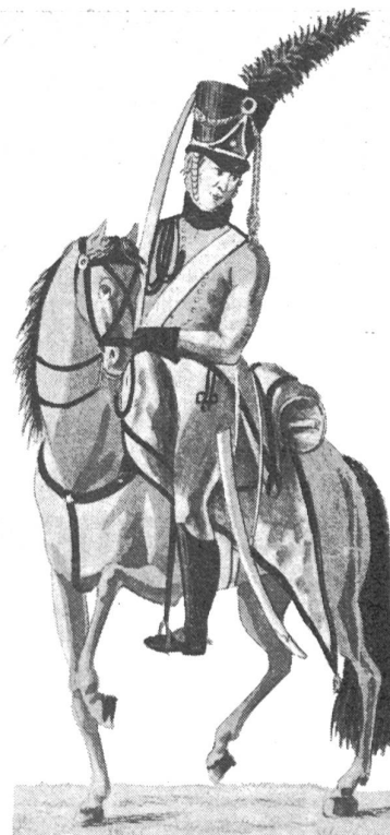
Alte Schweizer Uniformen 14