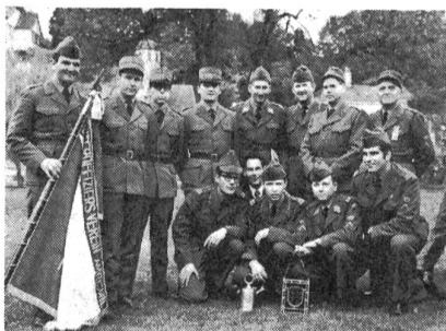
Sektion Amriswil, Sieger und Gewinner des KTV-Wanderpreises