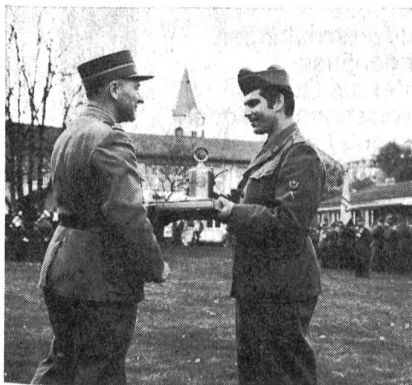
Major Rutishauser überreicht dem Präsidenten der Sektion Amriswil den Wanderpreis

345 FHD, Offiziere und Unteroffiziere aus den Kantonen Thurgau, St. Gallen, Appenzell, Graubünden, Glarus und Zürich haben über das Wochenende vom 25./26. Oktober 1969 in Weinfelden aktiv an den Thurgauischen KUT teilgenommen. Die Wettkämpferinnen und Wettkämpfer haben sich in folgenden Disziplinen gemessen: Hindernislauf, Befehlsgebung am Sandkasten, Nachtpatrouillenlauf, Militärisches Wissen und Schiessen. Mit 412,972 Punkten stand der UOV Amriswil an erster Stelle und