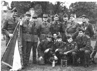
Sektion Amriswil, Sieger und Gewinner des KTV-Wanderpreises