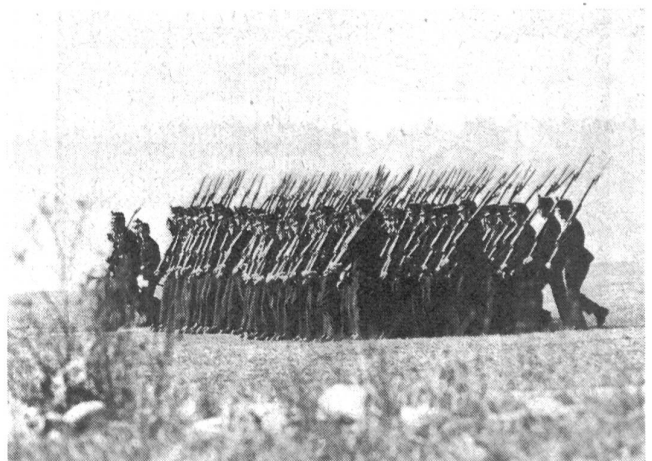
«Eine Kompanie Soldaten ...» Füsiliere von Anno 1914 beim Defilieren.

(Text: Herbert Alboth, Bern)