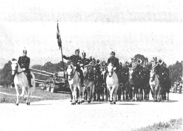
Ein farbenprächtiges Schauspiel: Kavallerie beim Defilée (hier die Kavallerie-Bereitermusik Bern) und beim Angriff. In wenigen Jahren wird das Wort Kavallerie aus unserem militärischen Vokabularium verschwunden sein.