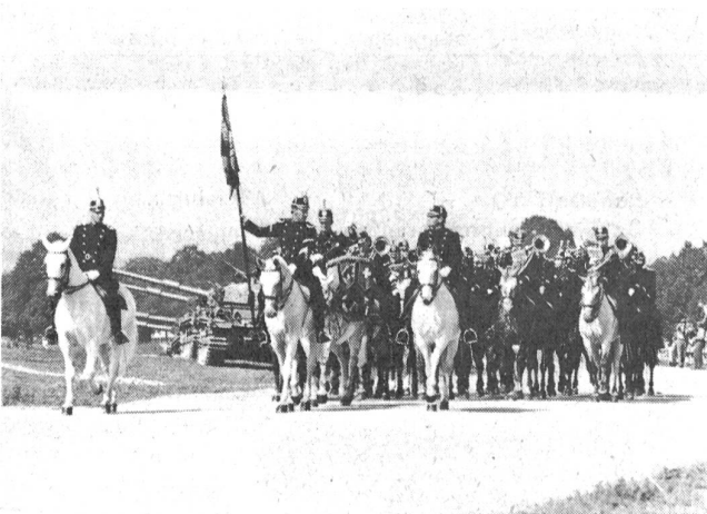
Ein farbenprächtiges Schauspiel: Kavallerie beim Defilee (hier die Kavallerie-Bereitermusik Bern) und beim Angriff. In wenigen Jahren wird das Wort Kavallerie aus unserem militärischen Vokabularium verschwunden sein.