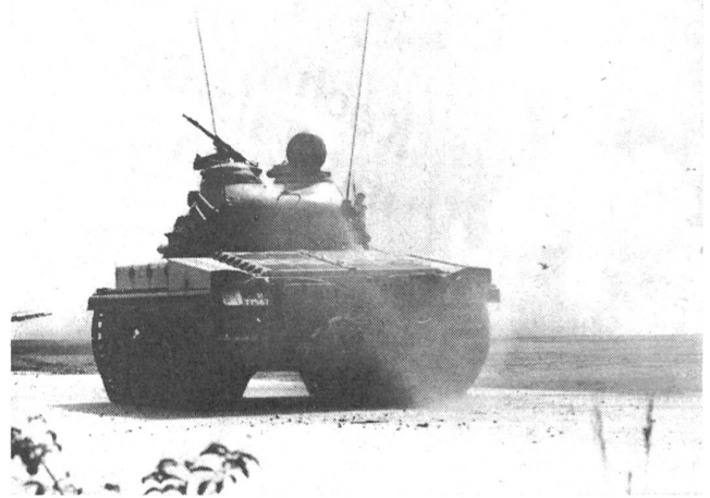
Wucht und Feuerkraft angreifender Panzer wurden eindrücklich demonstriert