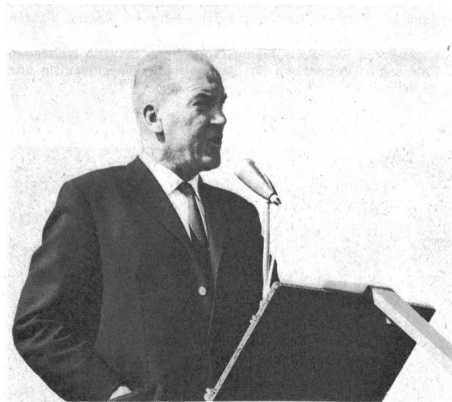
Bundesrat Rudolf Gnägi, Chef des EMD, anlässlich seiner Ansprache auf dem Schützenpanzer. «Unsere Ausbildung muss darauf ausgerichtet sein, die Fähigkeiten des einzelnen Wehrmannes und die Eigenschaften des verfügbaren Kriegsmaterials voll auszunützen. Durch stetige Verbesserung der Methodik und durch die Erschliessung geeigneter Übungs- und Schiessplätze müssen günstigere Voraussetzungen für eine kriegsnahe Ausbildung geschaffen werden.»