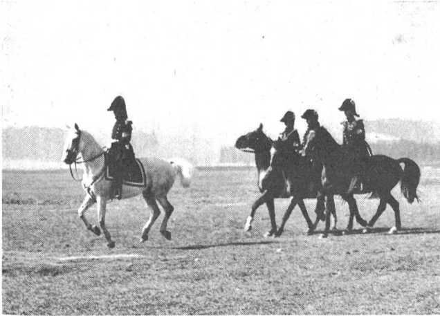
General Guillaume Henri Dufour (1787—1875) und sein Stab. Dufour machte die letzten Feldzüge Napoleons I. mit, wurde 1831 Chef des eidgenössischen Generalstabes; war erster Direktor des Waffenplatzes Thun (unter ihm wurde der nachmalige Kaiser Napoleon III. zum Artillerieoffizier ausgebildet); beendete siegreich den Sonderbundskrieg 1847; war 1856 Oberbefehlshaber der Armee, als das Königreich Preussen wegen Neuenburg mit Krieg drohte, und beendete sein reiches Lebenswerk mit der Schöpfung der Landeskarte 1:100 000, der sogenannten «Dufourkarte».