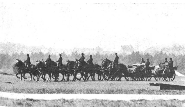
Eine Batterie Artillerie der alten Ordonnanz beim Exerzieren