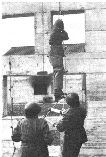
Übung mit der selbstverfertigten Strickleiter an der Übungsfassade

Die verschiedenen Bauten und Einrichtungen erlauben die Anlage eines idealen Zugsarbeitsplatzes. Das robuste Brandhaus, das unterkellert ist und sogar einen Fluchtweg besitzt, bietet sehr gute Voraussetzungen für alle mit der Bewachung und der Verteidigung von Objekten zusammenhängenden Übungen. Der Angriff auf ein Objekt kann in idealer Weise geübt werden, und zwar ohne Rücksicht auf Beschädigungen und ihre Folgen. Der nahe Wald bietet zudem eine günstige Gelegenheit für eine gefechtsstechnisch richtige Annäherung an eine Ortschaft oder an ein einzelnes Gebäude. Neben dem Brandhaus stehen einzelne massive Fassaden. Hier können Details, wie richtiger Einstieg durch Fenster, die Verwendung von Hilfs-