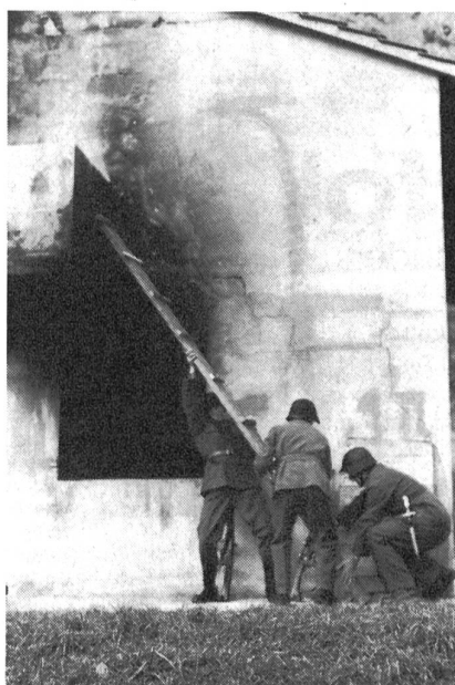
Grundsatz im Ortskampf: Räumen von oben nach unten — also Einstieg über den Balkon

Auf dem ganzen Areal lassen sich aber auch viele andere Ausbildungsthemen durchexerzieren. Die Trümmerpiste und die Wassergräben sind bestimmt gute Voraussetzungen zur Anlage von sogenannten Überlebenspisten (AC-Ausbildung, Kameranhilfe) und dienen wohl gleichzeitig als Nahkampf- und Körpertrainings-Par-