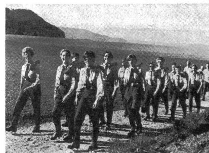
Lachend, sonnig und frohgemut — der FHD ...