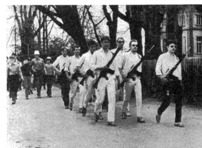
Jungschützen- und Vorunterricht-Gruppen legen mit Elan ihre zweimal 30 km zurück.

«Wir leben im Zeitalter der Weltraumfahrten, der Automation, der Mechanisierung. Schon kommt in der Schweiz auf 5,2 Einwohner ein Motorfahrzeug. Das Leben wird immer hektischer, der Zeitmangel ist akut und chronisch. Früher verrichtete man mehr oder weniger schwere körperliche Arbeit, die nun weitgehend durch gerissen konstruierte Maschinen besorgt wird. Doch unser Körper lässt nicht mit sich spassen. Er verlangt nach Betätigung. Für die Volksgesundheit ist