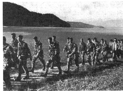
Ohne in Chauvinismus verfallen zu wollen: Unsere im Kampfanzug schneidig marschierenden Jung-Soldaten erweckten einen bestechenden Eindruck.