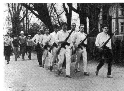
Jungschützen- und Vorunterricht-Gruppen legen mit Elan ihre zweimal 30 km zurück.

«Wir leben im Zeitalter der Weltraumfahrten, der Automation, der Mechanisierung. Schon kommt in der Schweiz auf 5,2 Einwohner ein Motorfahrzeug. Das Leben wird immer hektischer, der Zeitmangel ist akut und chronisch. Früher verrichtete man mehr oder weniger schwere körperliche Arbeit, die nun weitgehend durch gerissen konstruierte Maschinen besorgt wird. Doch unser Körper lässt nicht mit sich spassen. Er verlangt nach Betätigung. Für die Volksgesundheit ist