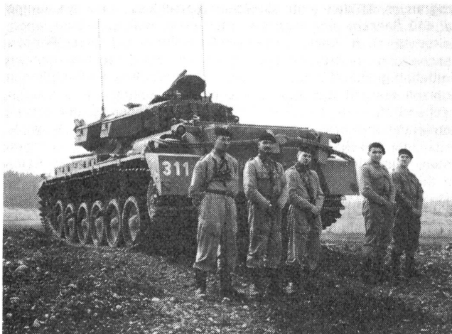
Ein «Centurion» und seine Besatzung