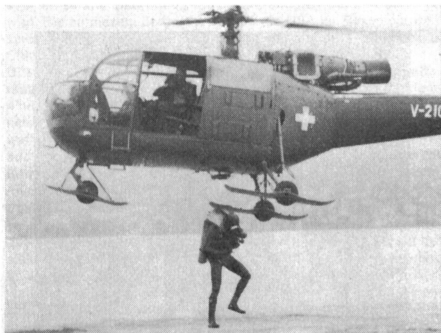
Helikopter setzt Kampftaucher ab