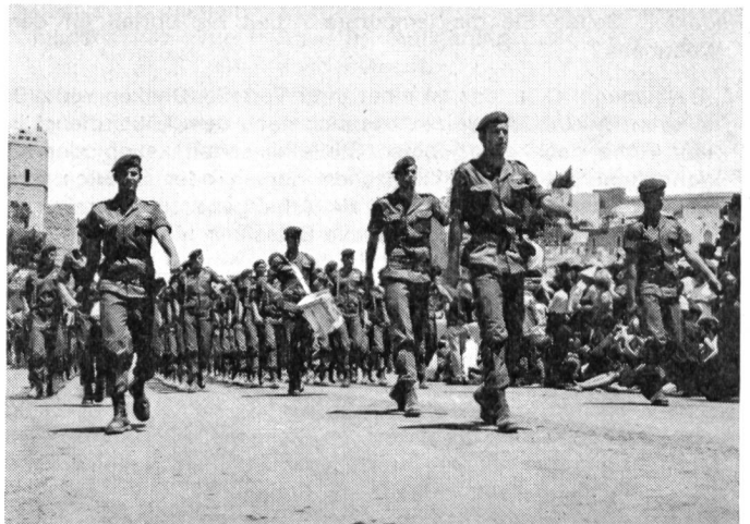
Unabhängigkeitstag in Jerusalem 1968