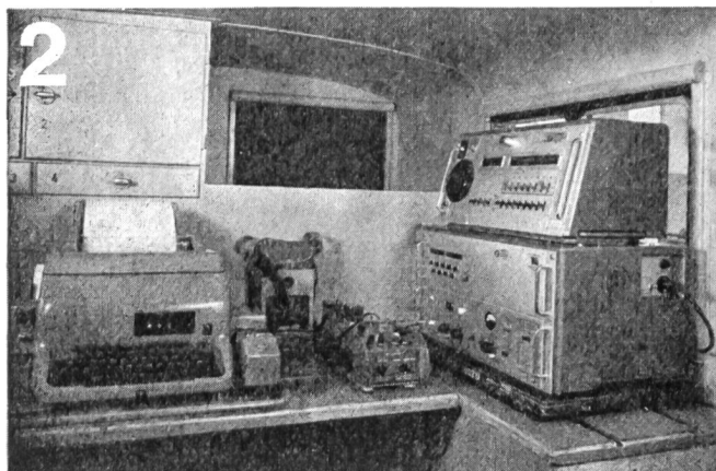
Zellweger AG., Uster/ZH Apparate- und Maschinenfabriken Uster