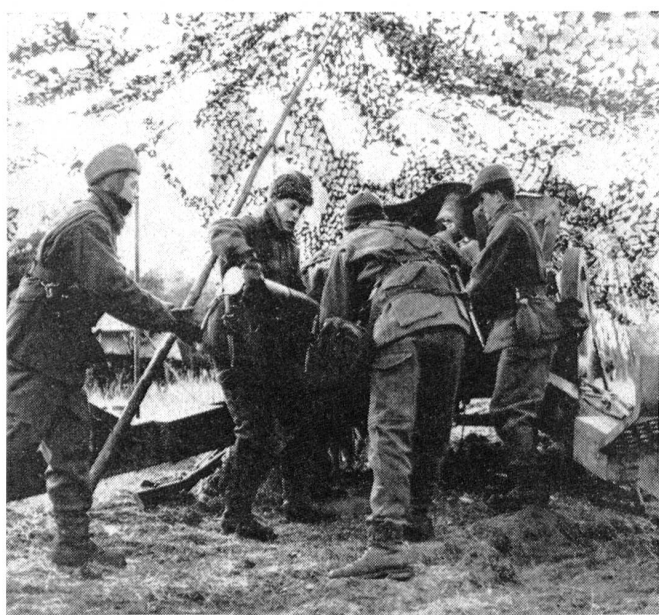
Geschützstellung einer 15-cm-Kanone der schwedischen Artillerie. Die Artillerie ist daran, sich weitgehend auf Selbstfahrgeschütze umzustellen, die in Schweden entwickelt wurden. Wir haben in einer früheren Nummer des «Schweizer Soldat» ein solches Geschütz vom Kaliber 15,5 cm im Bild gezeigt, das sich bei der praktischen Truppenerfahrung in Lappland glänzend bewährt hat.