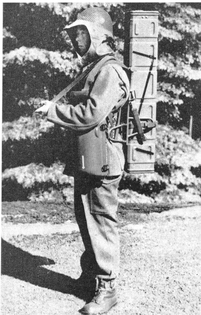
Auch in der Schweiz bekannt und eingeführt ist die Panzerabwehrrakete «Bantam» der Boforswerke, deren Abschußeinrichtung von einem Mann getragen werden kann und die nicht mehr als 19 kg wiegt. Die Rakete wird mittels Draht direkt ins Ziel gelenkt und verfügt mit hoher Präzision und Wirkung über eine Schußweite bis zu 2000 m.