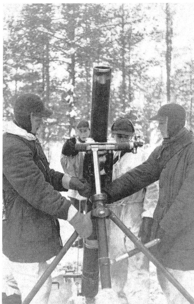
Zur Bewaffnung der Infanterie gehören auch diese 12-cm-Minenwerfer.