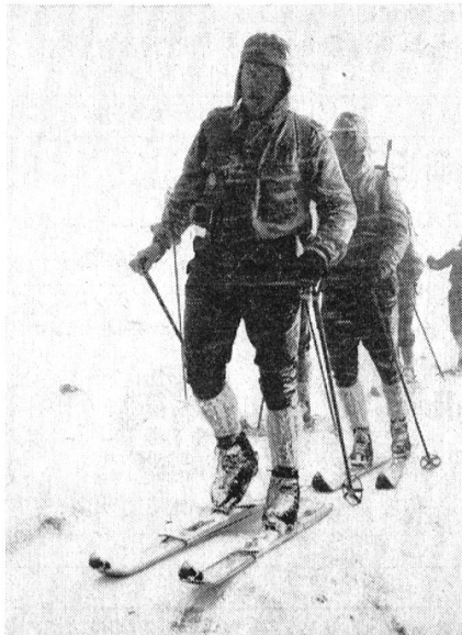
Eine Gruppe der Gebirgsjäger aus Mittenwald, Vertreter der 1. Deutschen Gebirgsdivision, die immer wieder nach dem Obersimmental kommen.

für die gute Organisation, die sich schon mehrmals schwierigsten Anforderungen gewachsen zeigte, Anerkennung über die Landesgrenzen hinaus gefunden. Unsere Bilder sollen allen Interessenten einen Eindruck der geforderten Leistung vermitteln.