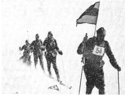
Patrouille des UOV Zug auf der sturmgepeitschten Höhe des Gandlauenengrattes, auf über 2000 m Höhe.