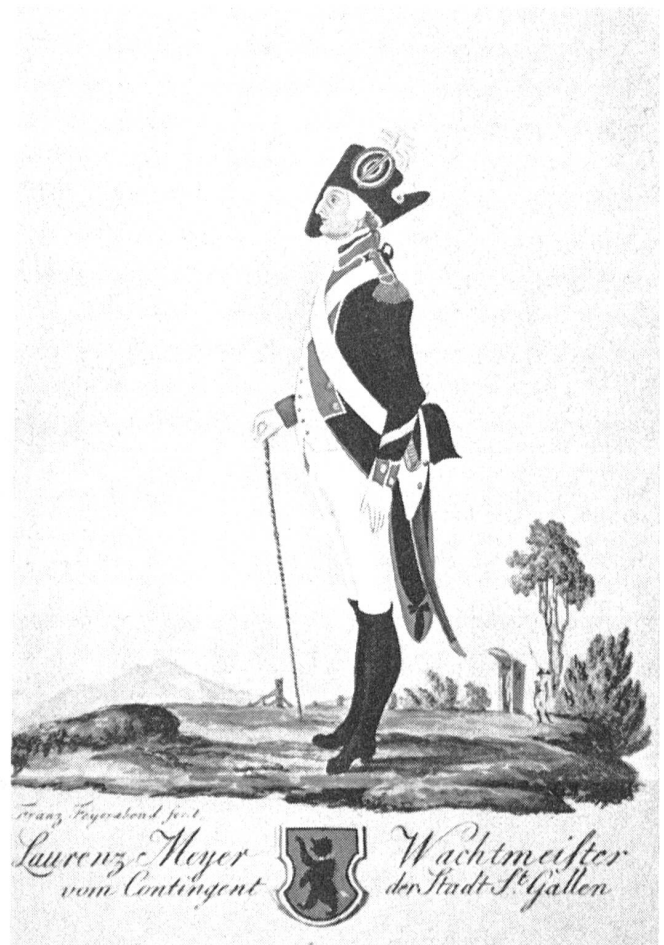
Stadt St. Gallen 1792

Fahne: In der Mitte weißes Wappenschild mit schwarzem, aufrechtem Bären. Von der Mitte aus abwechselnd rot-weiß-schwarz-weiß-rot-weiß-schwarze Flammen. Im Hintergrund eine Mühle mit Wasserrad.