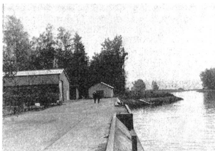
Das als Musterbeispiel dienende Ausbildungslager von Sugiez liegt romantisch zu Füßen des Mont Vully und am Kanal, der den Bieler- mit dem Murtensee verbindet.