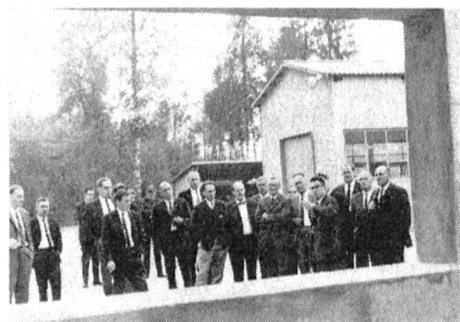
Die Unteroffiziere zeigten sich als sehr interessierte Kursteilnehmer, nicht nur nach den Referaten und Filmvorführungen, wo z. B. am Samstag bis Mitternacht diskutiert wurde, sondern auch während der Besichtigung der verschiedenen Anlagen dieses beispielhaften Ausbildungszentrums, das auch im Ausland große Beachtung findet.