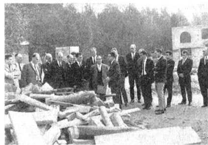
Trümmerhaufen in allen Formationen Rauch und Feuer gehören auch in Sugiez zur realistischen Ausbildung von Kadern und Mannschaften des Zivilschutzes.