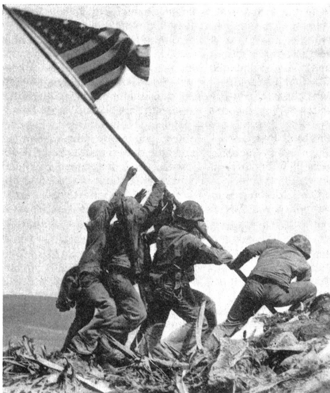
Amerikanische Marinetruppen auf Jwo Jima. Dieses Bild gab die Vorlage zum Ehrenmal des US Marine Corps in Washington.

des Kriegers, finden wir die Grundeinstellungen der japanischen soldatischen Führer und ihrer Gefolgschaften, die machtvollen Faktoren der Kampfmoral der Einheiten der Streitkräfte Nippons waren. *) Bushido bedeutet den ent-