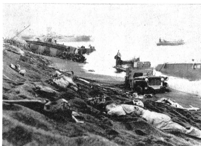
Trotz schwerer Verluste an Menschen und Material hat das US Marine Corps die Landung erzwungen.

In den Vorkriegsjahren genoß der amerikanische Soldat sehr wenig Ansehen in den Vereinigten Staaten. Der Militärdienst war nur ein Job wie viele andere. Es gab Hotels und Restaurants, die Hunden und Soldaten den Zutritt untersagten. Dementsprechend mußte auch die Einstellung der jungen Amerikaner zum Militärdienst sein. Spezifisch menschliche Verhaltensweisen werden erlernt und sind daher in jeder Kultur verschieden (Theodore M. Newcomb)! Die Kampfmoral der japanischen Armee wurzelte in der Staatsreligion des Zen-Buddhismus, der an und für sich gar nicht kriegerisch ist und in keiner Weise zum Kampf mit der Waffe auffordert, sondern eine Religion des Mitleidens und des Willens ist. Aber Leben und Tod sind für den Zen nicht zweierlei Dinge. Der Zen-Buddhismus läßt den Gläubigen nicht mehr nach rückwärts blicken, wenn die Richtung des Weges einmal entschieden ist. Für den freiwilligen Tod im Dienste des Vaterlandes verspricht er Ruhm auf Erden und nach dem Tode die Aufnahme in das Paradies der Ahnen. Im Bushido, dem Weg