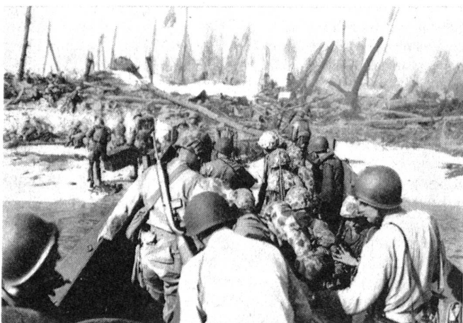
US Marine Corps erobert Kwajalein.