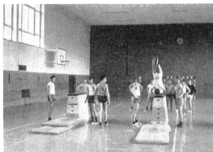
Was früher nur in der Offiziersschule gemacht wurde, wie der Handstandüberschlag auf dem Bilde, wird bereits ins RS-Programm aufgenommen.