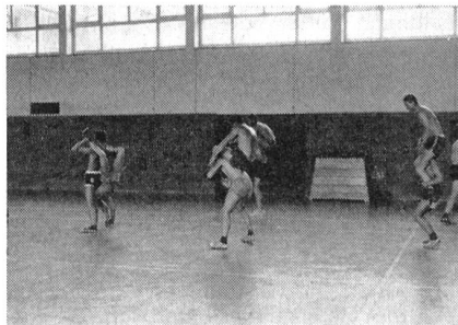
«Fortlaufender Handstand», eine Übung, die alle gerne ausführen und die zugleich die Muskeln recht beansprucht.