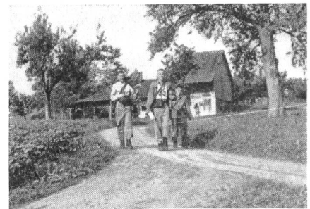
Das erste Ziel des Armeesportes: Kondition für den Dienst. Hier Pz. Gren.-Uof.-Schüler am Ende eines 40-km-Leistungsmarsches.

Zur Stärkung der körperlichen Leistungsfähigkeit ist in der RS die Zahl der Turnlektionen auf 80 erhöht worden. Der Zugführer erhält ein Blatt für die zeitliche und stoffliche Aufteilung des Armeesportes in der RS. In jeder Lektion wird auf einem bestimmten Gebiet wie Krafttraining, Lauf, Geschicklichkeit, Test usw. ein Schwergewicht gelegt. So sieht zum Beispiel das Programm für die 48. Lektion in der neunten RS-Woche folgendermaßen aus: Einlaufen, Gymnastik (eine der vier «gymnastischen Reihen») Schnelligkeit, Schwergewicht, Nahkampf, kleine Spiele.