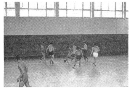
Eine Turnstunde soll auch Freude und Entspannung bringen, und deshalb gehört zu jeder Lektion ein Spiel, auch wenn es nur fünf Minuten dauert.