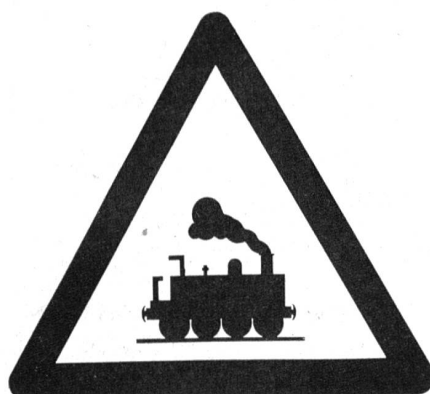
Bahnübergang ohne Schranken