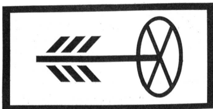
Zusatztafel «Militärische Straßenbenützer gestattet»

Die ersten gelb-schwarzen Signale sind aufgestellt und können bereits in der Nähe von Waffenplätzen sowie auf Zufahrtsstraßen zu militärischen Schieß- und Übungsplätzen angetroffen werden.