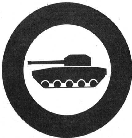
Verbot für Panzer