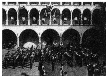
Das Schweizer Armeespiel konzertiert im Stockalperpalast zu Brig

So kam es 1960 zur Aufstellung des «Schweizer Armeespiels», das damals 60 Mann zählte und heute deren 90. Administrativ ist das Armeespiel der Abt für Inf unterstellt und wird von ihr für spezielle Anlässe aufgeboden, wenn kein anderes Spiel zur Stelle ist oder die Umstände ein Elitemusikkorps erheischen. Als Unterscheidungsmerkmal zu den Rgt- und Bat-Spielen dürfen die Armeespielmusici eine schmutzige Kordel am linken Schulterstück tragen. Ferner gehören zur Galauniform noch die weißen Handschuhe und das altbewährte, lange Bajonett! Es versteht sich von selbst, daß nur die allerbesten Spielunteroffiziere, Trompeter